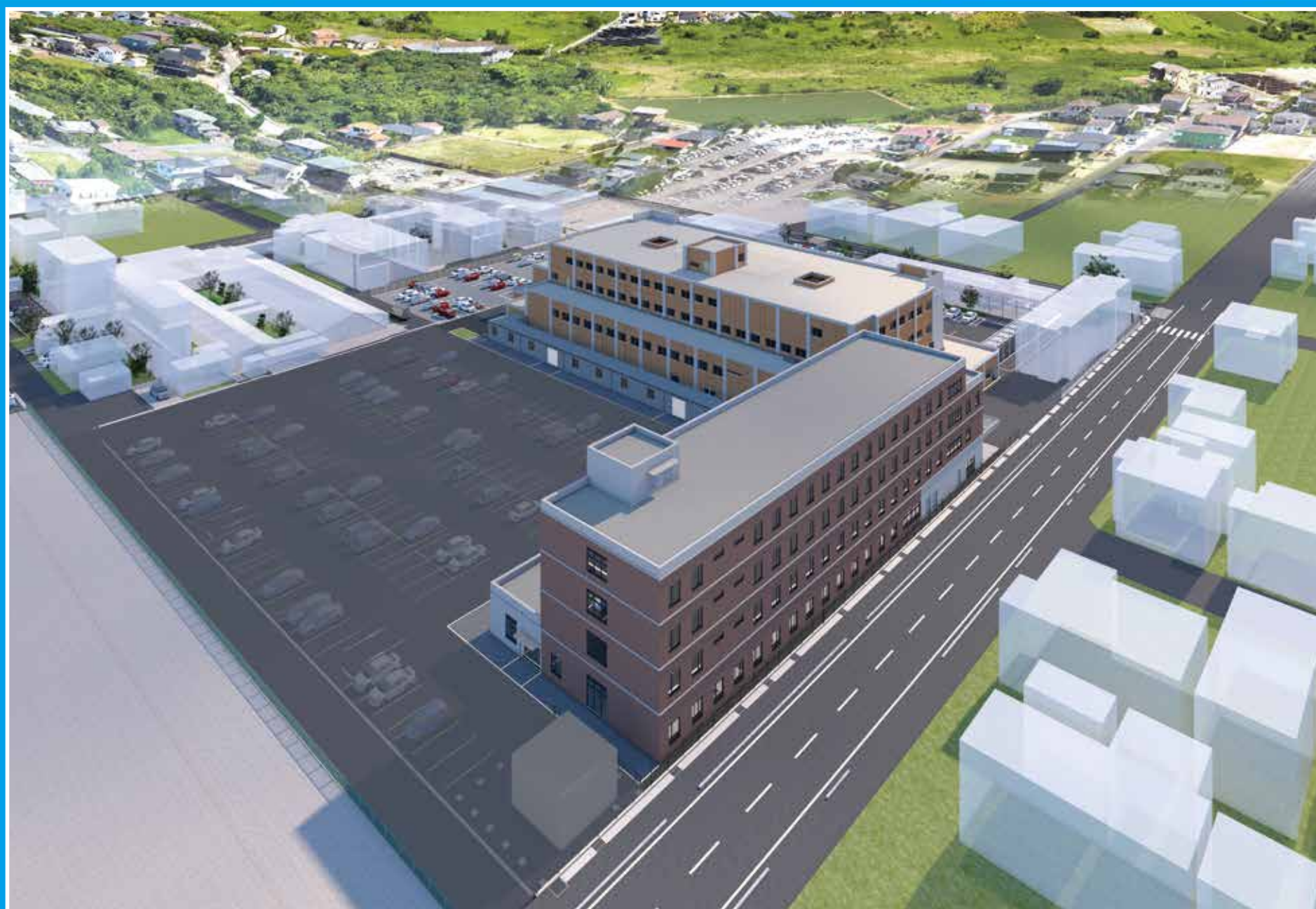
上空からのイメージ_01