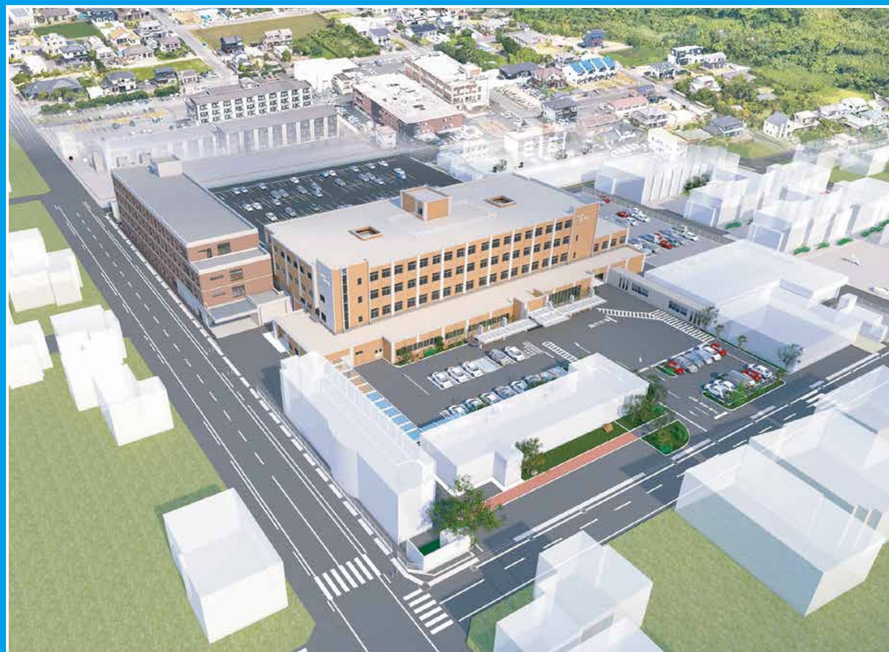
上空からのイメージ_02