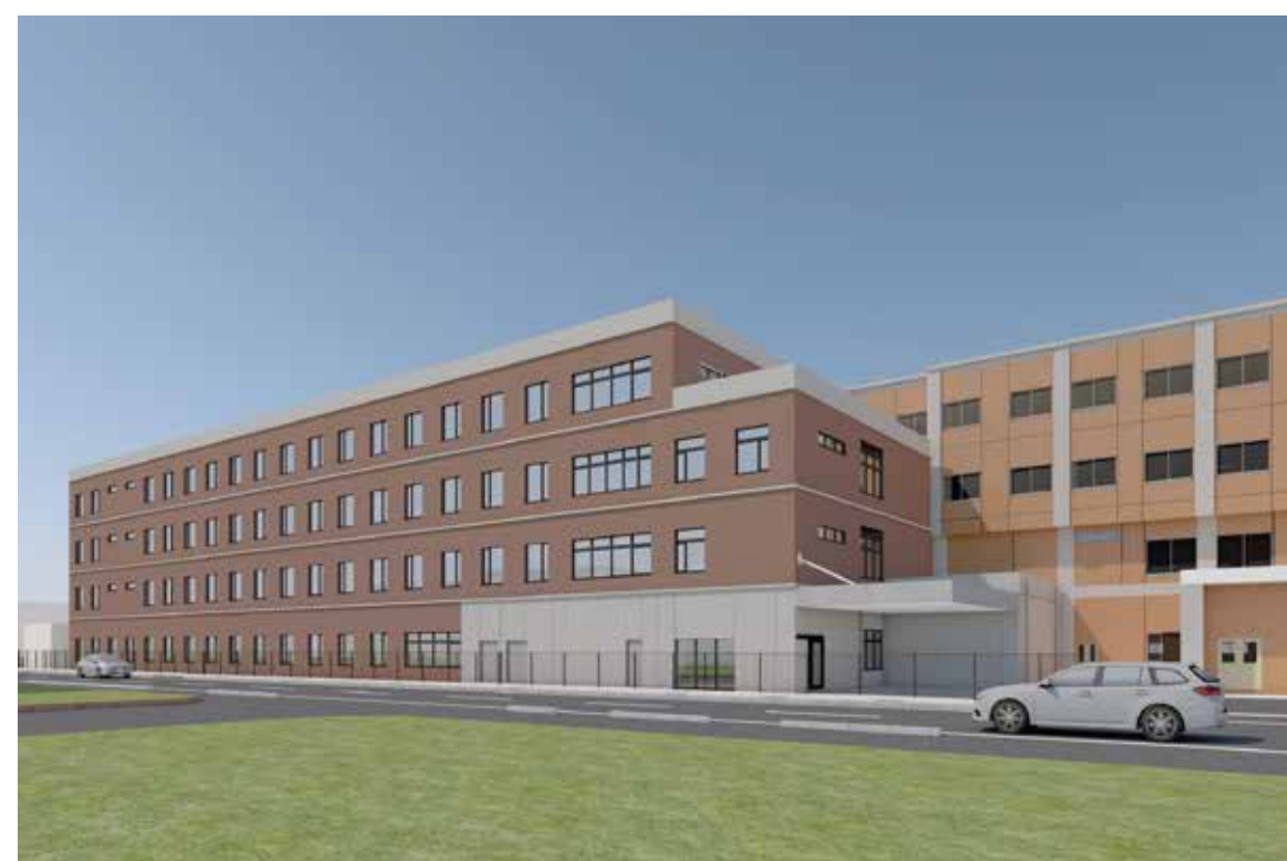
外観イメージ_南西