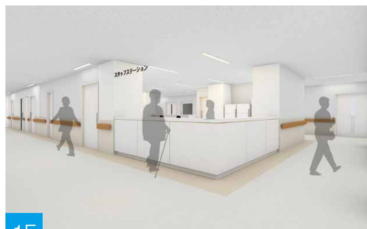
1F スタッフステーション