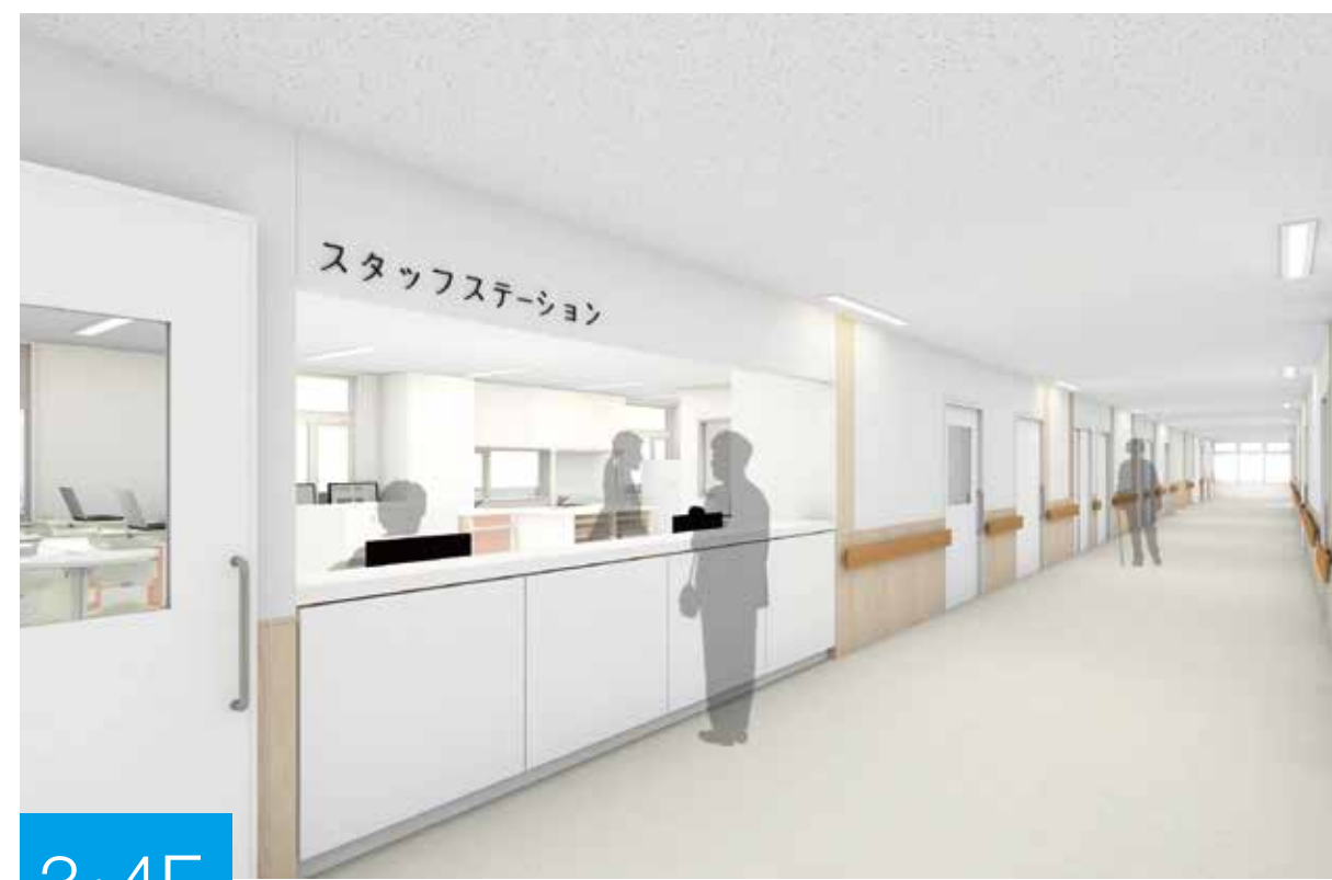
3・4F スタッフステーション