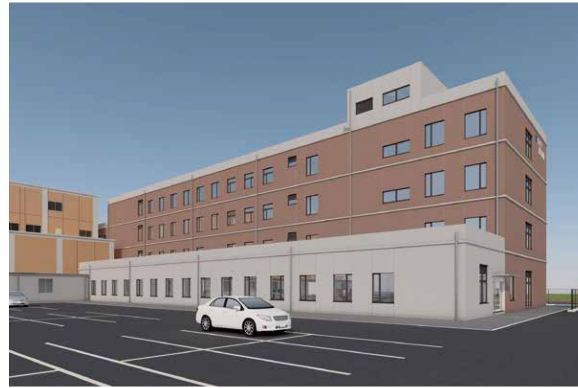
外観イメージ_北東